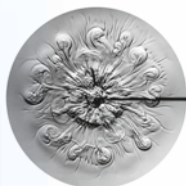
Eau de source

La méthode de l'image de goutte donne des indications sur la qualité de l'eau en tant que nutriment et source de vie.