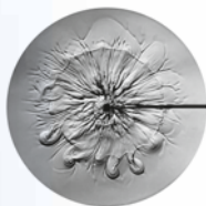
Eau du robinet