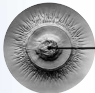
Nicht abgebautes Waschmittel im Wasser